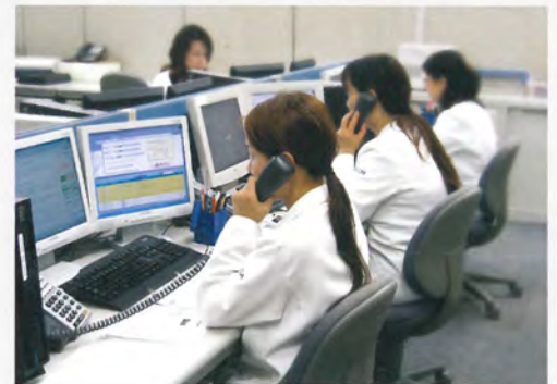
セコムナースセンター

診療科目／病院種別(救急病院、リハビリ、歯科等)／診察日時(休診日、土日・夜間)等